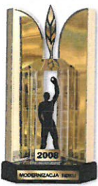
MODERNIZACJA ROKU 2008