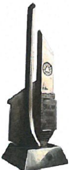
BUDOWA ROKU 2003